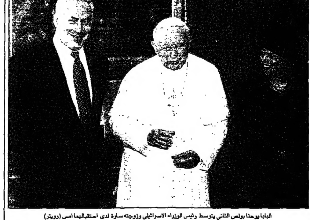
البابا يوحنا بولس الثاني ورئيس الوزراء الإسرائيلي ويوزجته سارة لدى استقبالها امس

الفايتكان - اب - دعا رئيس الوزراء الإسرائيلي بنيامين نتنياهو البابا يوحنا بولس الثاني في زيارة القدس، في أثر اجتماعه مع امس الاثنين في الفايتكان. وقال نتنياهو، إن زيارة البابا إلى القدس هي علامة على التحول في العلاقات بين الشرق الأوسط والغرب.